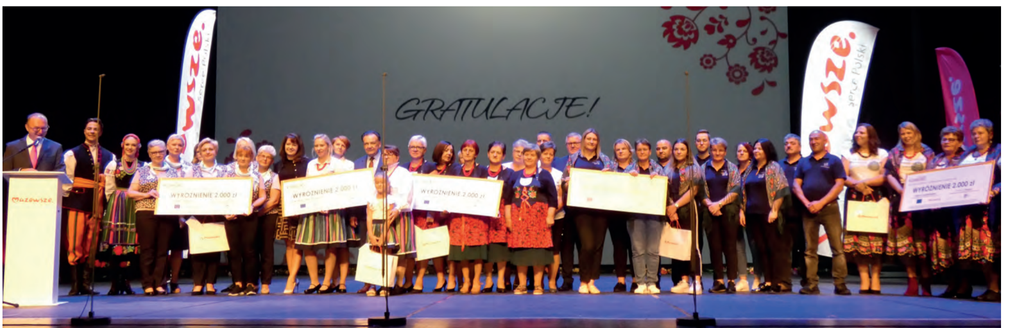
▲ Scena zapelniona się kolorowymi strojami KGW

I miejsce: Koło Gospodyń Wiejskich w Starym Kębłowie, gm. Żelechów, 8.000 zł