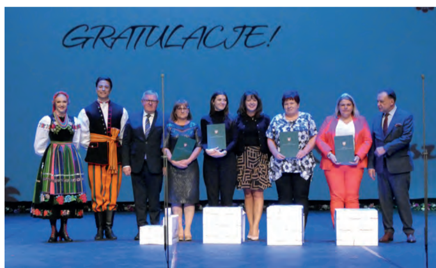
▲ Na gali zakończono w sumie cztery konkursy

Mieszkańcy sołectw zaangażowali się w realizację projektu. Wspólnie przygotowali miejsce pod altankę, uporządkowali teren – wykarczowali drzewa, wycięli i obrobili bale do altanki, wyrównali teren i zalali betonem posadzkę pod altankę.