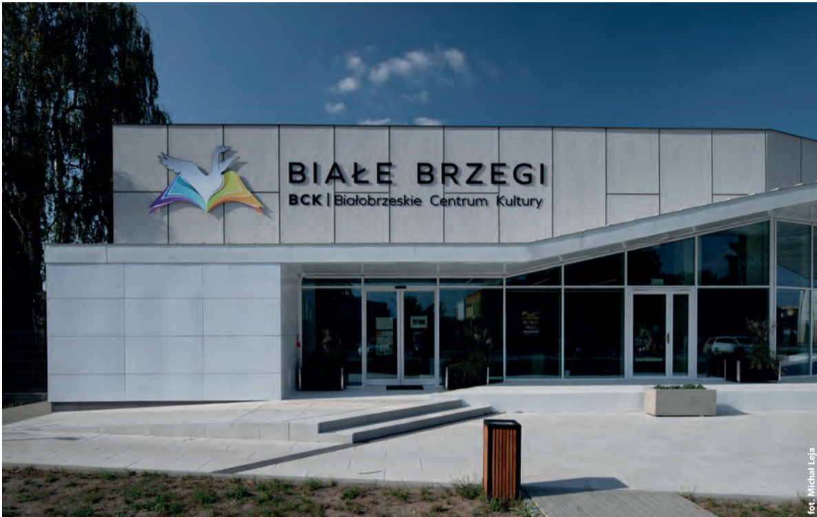
W budowie nowej części Białobrzegskiego Centrum Kultury pomógł Sejmik Województwa Mazowieckiego

Aż 782 inwestycje udało się w tym roku zrealizować w subregionie radomskim dzięki pomocy Sejmiku Województwa Mazowieckiego. Prawie 325 mln zł władze regionu przeznaczyły na nowe drogi, boiska, rozbudowę szkół, przedszkoli czy szpitali. Trwają nabory do przyszłorocznych programów! Warto z nich skorzystać.